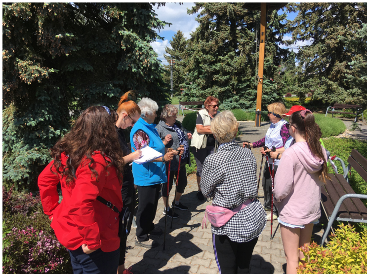
▲ Zdravotní procházka se konala v rámci projektu Komunitní sociální práce na venkově.