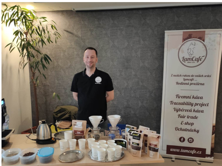
▲ Káva s příběhem – přednášku pro milovníky kávy připravil majitel pražírny Lamcafé.