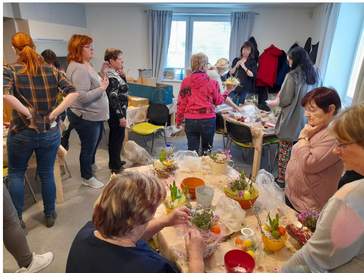
▲ Jarní tvoření přilákalo mnoho žen nejen z Mokrovous.