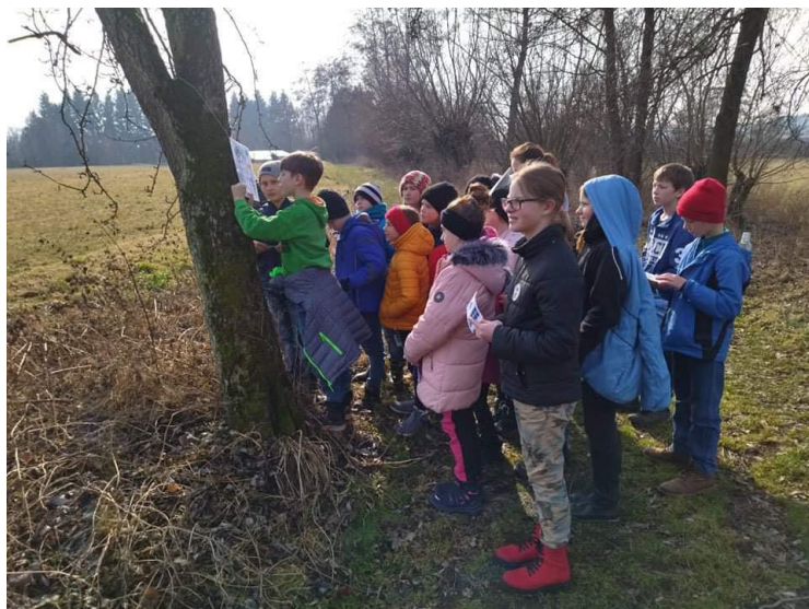
▲ Masopustní stezku si mohl každý projít v únoru letošního roku. Využili ji především děti.