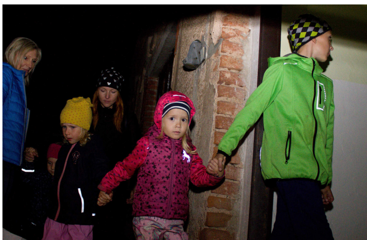
▲ Strašidelná stezka vedla do čp. 61.