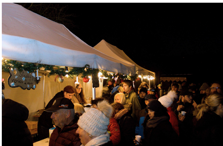
▲ První adventní neděle přilákala místní i přespolní.