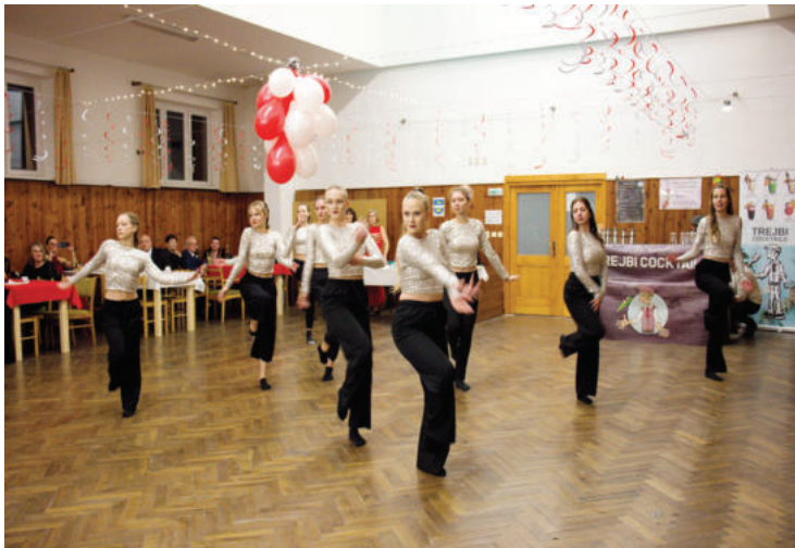
▲ 7. března - ples obce Mokrovousy.