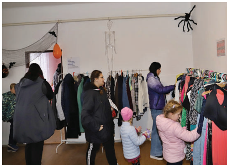
▲ 11. října - První SWAP (výměna věcí aneb "dejte věcem druhou šanci").