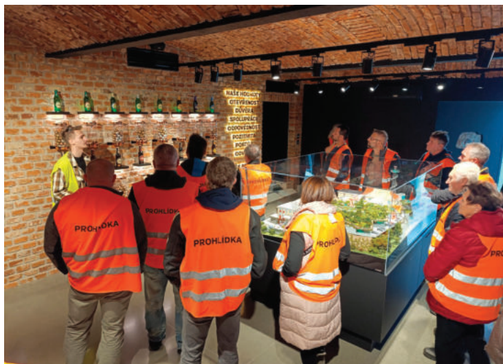
▲ 4. října - zájezd do Pivovaru Bernard.