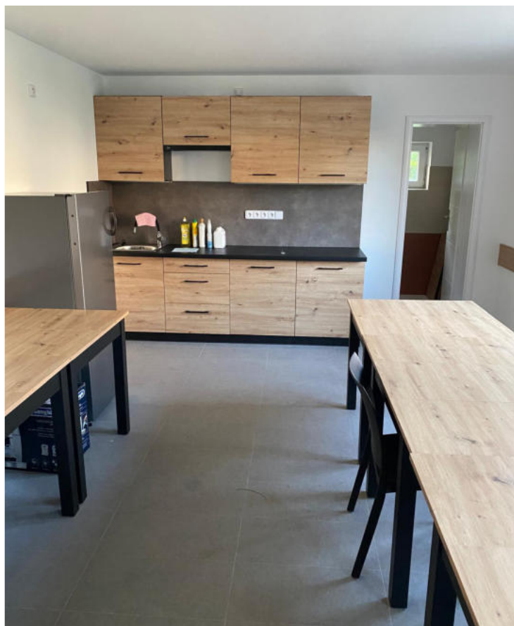
▲ Pohled do klubovny po rekonstrukci.