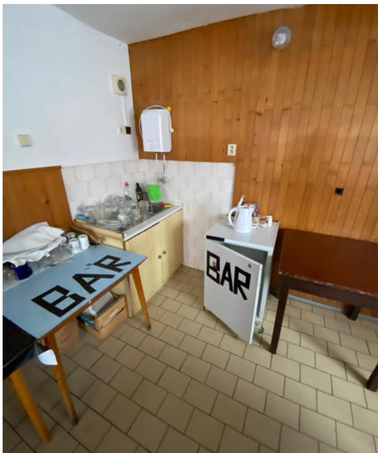
▲ Původní prostor kuchyňského koutku.