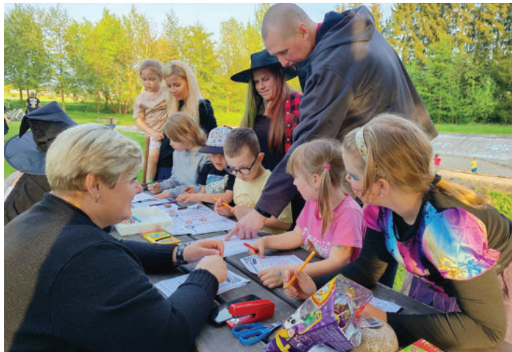
▲ 30. dubna - čarodějnické odpoledne.