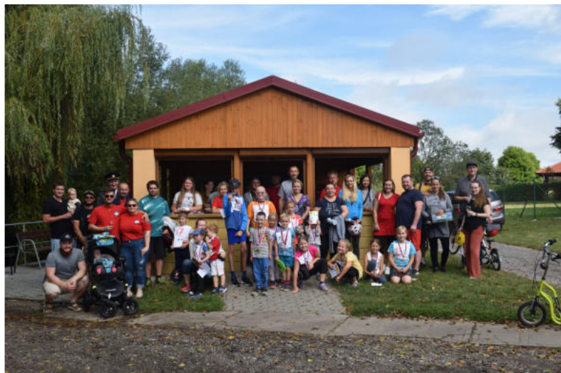
▲ Koloběžkiáda a slavnostní otevření klubovny 30. srpna 2025.