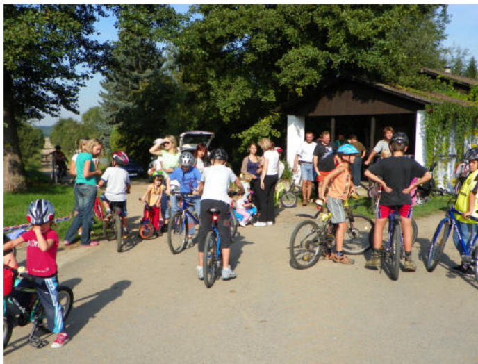
▲ Koloběžkiáda z roku 2011.