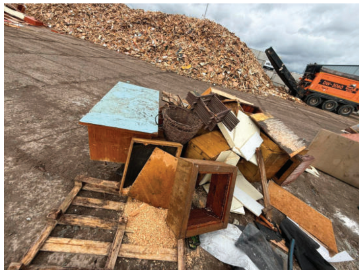
▲ Velkoobjemný odpad dále putuje na třídící linku, kde se podaří spoustu odpadu vytřídit do tzv. třídící složky. Například dřevo a nábytek.