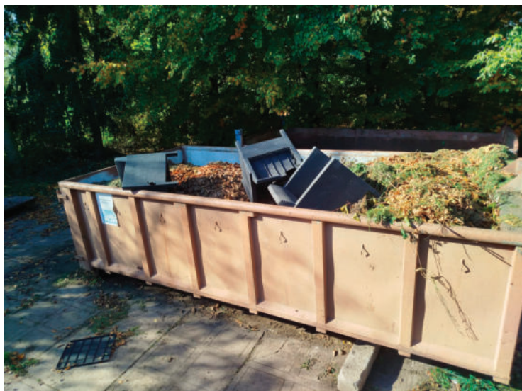
▲ Kontejner na biologický odpad rostlinného původu - letos jsme v něm našli plastový nábytek.